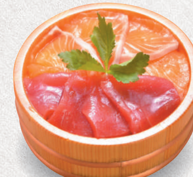
マグロ・サーモン丼 2,300円 Tuna & salmon sashimi bowl