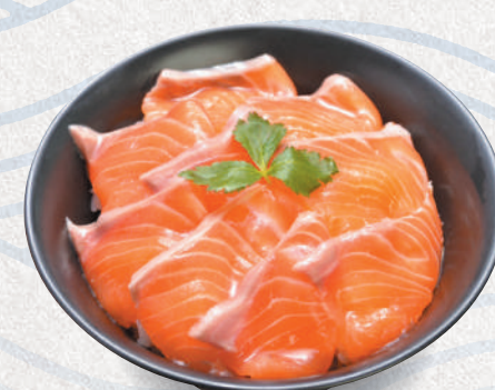
生サーモン丼 2,000円 Salmon sashimi bowl