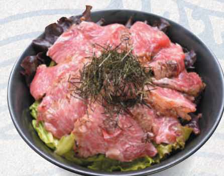
クロマグロのホホテキ丼 4,800円 Bluefin tuna cheek meat steak bowl 希少部位のため 数量限定!