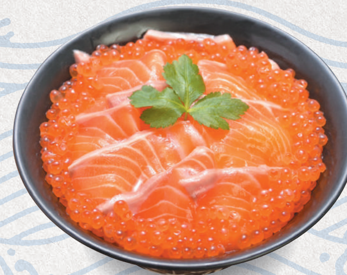
いくらとサーモンの親子丼 2,400円 Salmon sashimi & salmon roe bowl