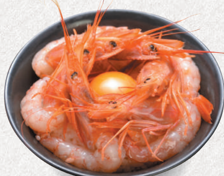
特大赤えび丼 2,200円 (つまんでご卵の卵黄付き) Large red rice prawn sashimi bowl