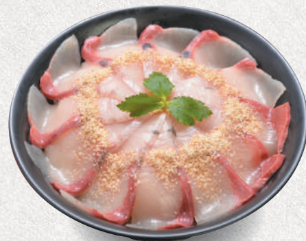
ごまカンパチ丼 2,000円 Sesame sauce marinated amberjack sashimi bowl