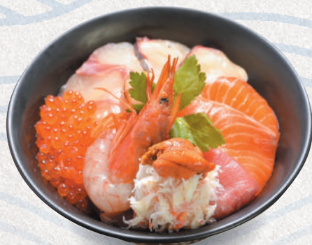
糸島海鮮丼<上> 3,800円 Itoshima sashimi bowl (Superior)