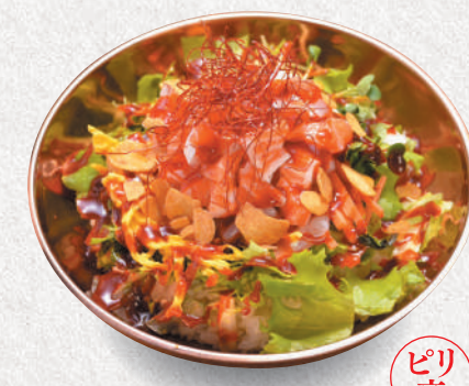
韓国海鮮丼 2,400円 Korean-style spicy seafood bowl