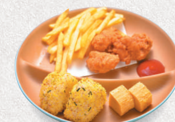
お子様プレート 500円 (おにぎり・唐揚げ・フライドポテト) Kids combo