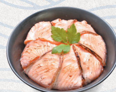
炙りサーモン丼 2,300円 Roasted salmon bowl