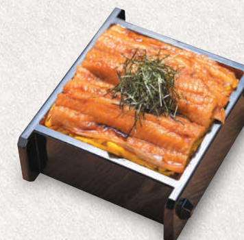
穴子のせいろ蒸し 3,000円 Steamed sea eel