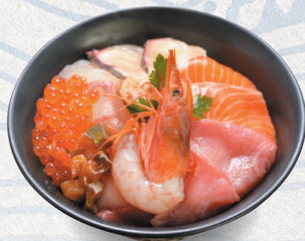
糸島海鮮丼<並> 2,800円 Itoshima sashimi bowl (Regular)