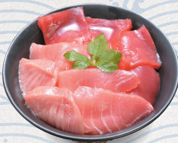
クロマグロの三色丼 3,300円 Bluefin tuna variety sashimi bowl