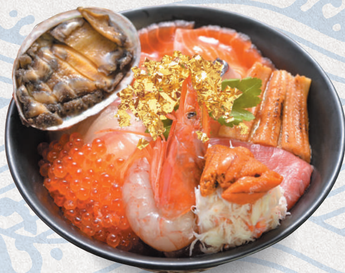
糸島海鮮丼<極上> 4,800円 Itoshima sashimi bowl (Deluxe)