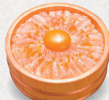
甘えび丼 1,800円 (つまんでご卵の卵黄付き) Pink shrimp sashimi bowl