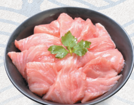
大トロ丼 4,800円 Fatty tuna sashimi bowl