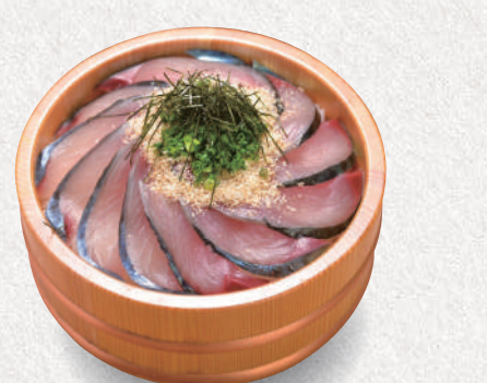
ごまサバ丼 2,000円 Sesame sauce marinated mackerel sashimi bowl